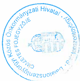
Török Csilla címetes főjegyző