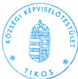
Török Csilla címetes főjegyző